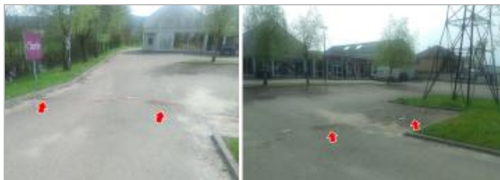
Vues du site en 2024 avec le repère de la crue d'avril 2024