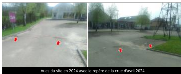
Vues du site en 2024 avec le repère de la crue d'avril 2024

GÉOLOCALISATION Coordonnées WGS84 : X: 4.28305607 / Y: 46.95687480 Coordonnées RGF93 (Lambert 93) : X: 797568.47 / Y: 6651533.72 Coordonnées RGF93 (ETRS89) : X: 4.2830561 / Y: 46.9568748 Code Hydro: K1--0180 Rive de référence: Gauche