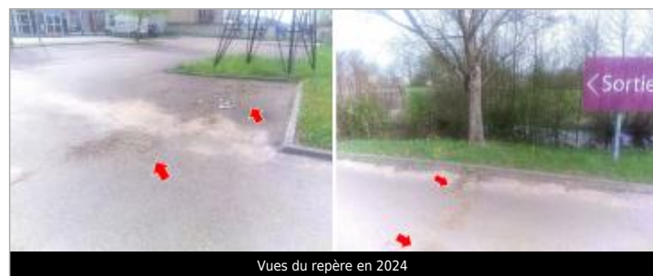
Vues du repère en 2024

GÉNÉRAL Code : 24LACIAX2_R_107_1 Date de mise à jour : 06/03/2025 Auteur : SPC LACI