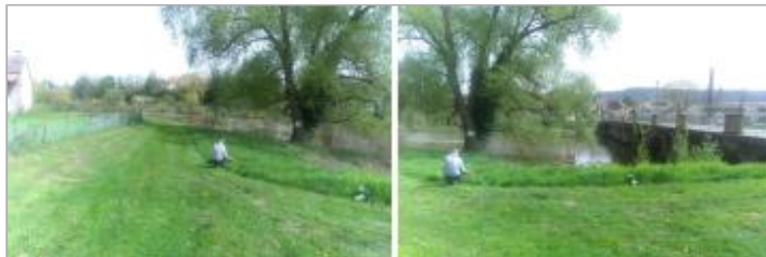
Vues du site en 2024 avec le repère de la crue d'avril 2024