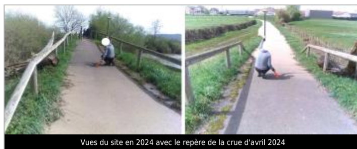
Vues du site en 2024 avec le repère de la crue d'avril 2024