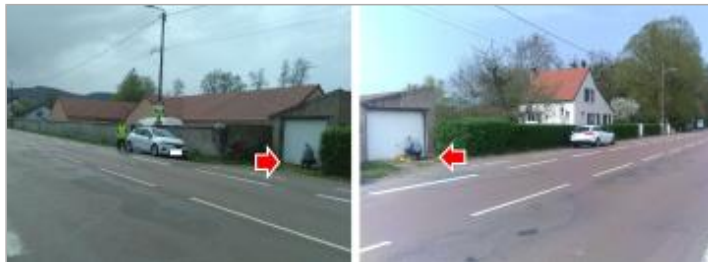
Vues du site en 2024 avec le repère de la crue d'avril 2024