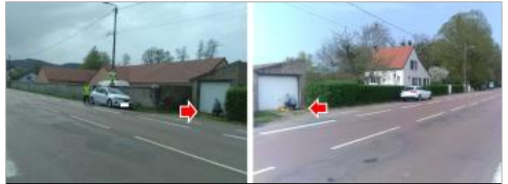
Vues du site en 2024 avec le repère de la crue d'avril 2024