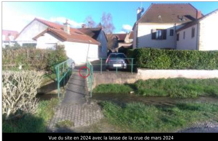
Vue du site en 2024 avec la laisse de la crue de mars 2024