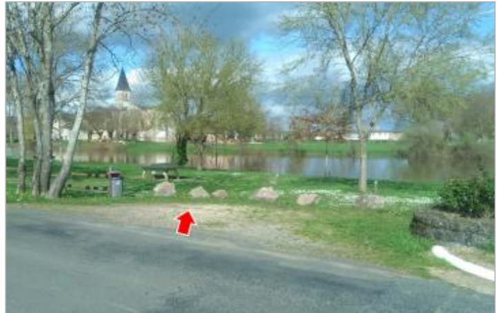
Vue du site en 2024 avec la laisse de la crue de mars 2024

Coordonnées WGS84 : X: 4.06477600 / Y: 46.62569700