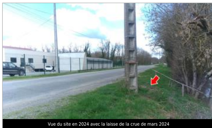
Vue du site en 2024 avec la laisse de la crue de mars 2024

GÉOLOCALISATION Coordonnées WGS84 : X: 4.13379200 / Y: 46.70224400 Coordonnées RGF93 (Lambert 93) X: 786624.75 / Y: 6623082.68 Coordonnées RGF93 (ETRS89) : X: 4.133792 / Y: 46.702244 Code Hydro: K1--0180 Rive de référence: Droite