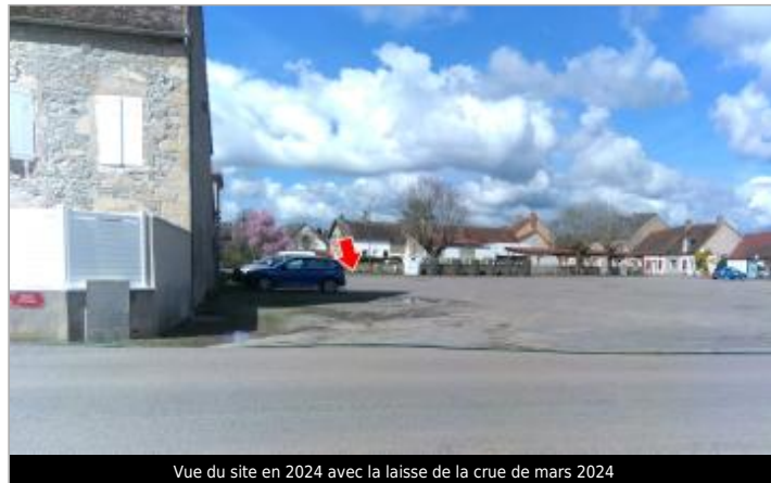
Vue du site en 2024 avec la laisse de la crue de mars 2024