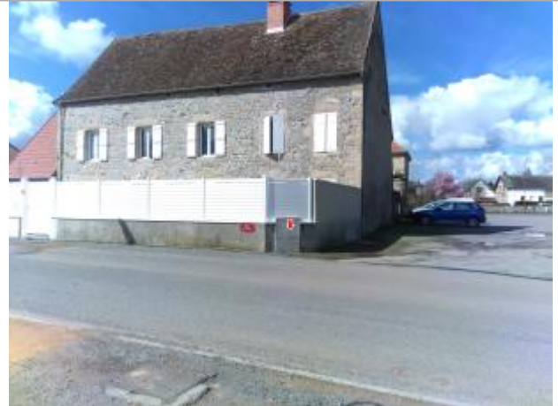
Vue du site en 2024 avec la laisse de la crue de mars 2024