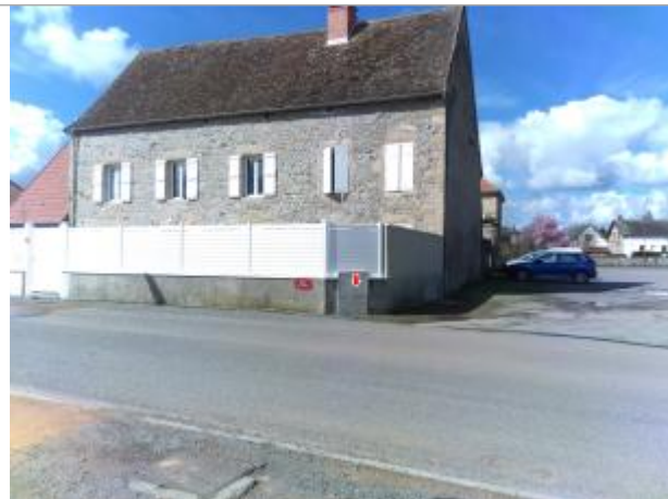
Vue du site en 2024 avec la laisse de la crue de mars 2024