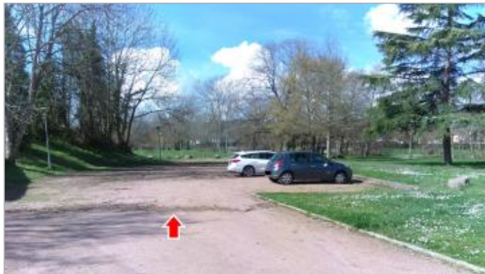
Vue du site en 2024 et de la laisse de la crue de mars 2024