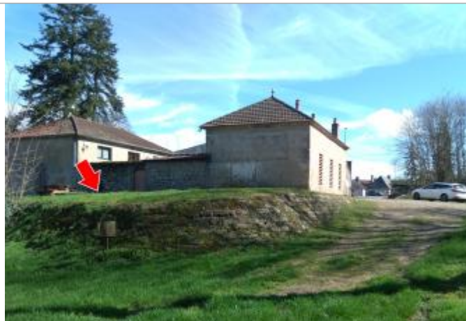
Vue du site en 2024 avec la laisse de la crue de mars 2024

Coordonnées WGS84 : X: 4.13824800 / Y: 46.69606700