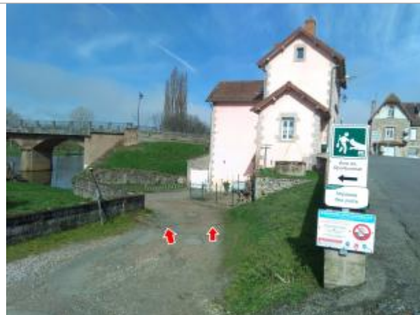
Vue du site en 2024 avec laisse de la crue de mars 2024