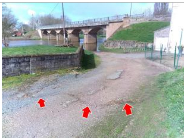
Vue du repère en 2024