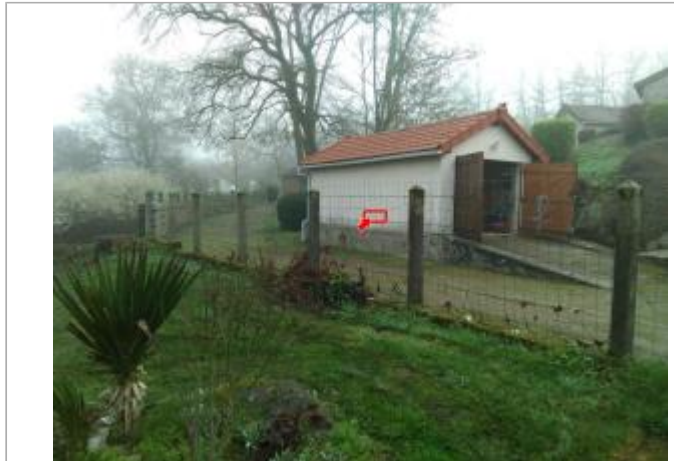
Vue du site en 2024

Coordonnées WGS84 : X: 4.19043900 / Y: 46.87765800