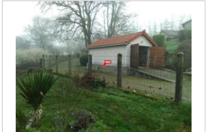
Vue du site en 2024

Coordonnées WGS84 : X: 4.19043900 / Y: 46.87765800