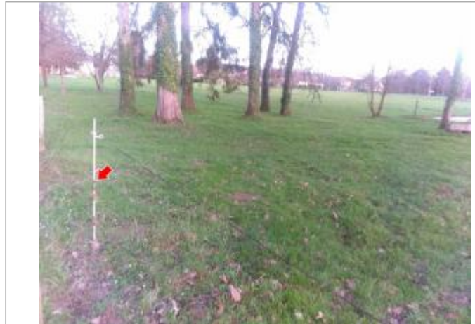
Vue du site en 2024

Coordonnées WGS84 : X: 4.18717400 / Y: 46.87013700