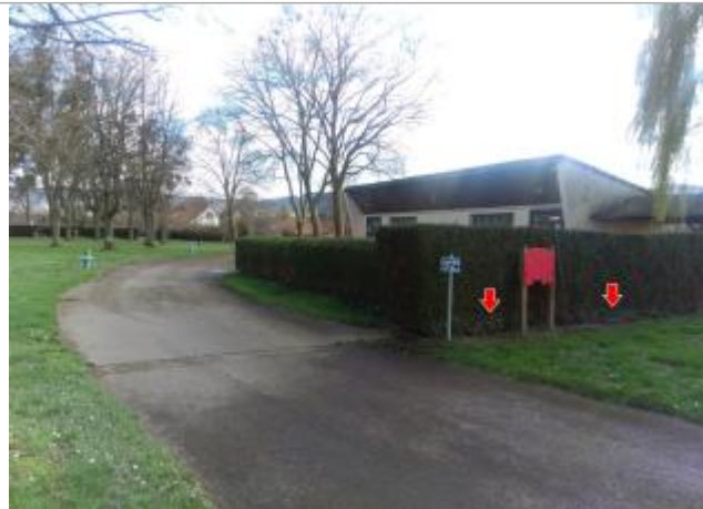
Vue du site en 2024

Coordonnées WGS84 : X: 4.29279200 / Y: 46.96422000