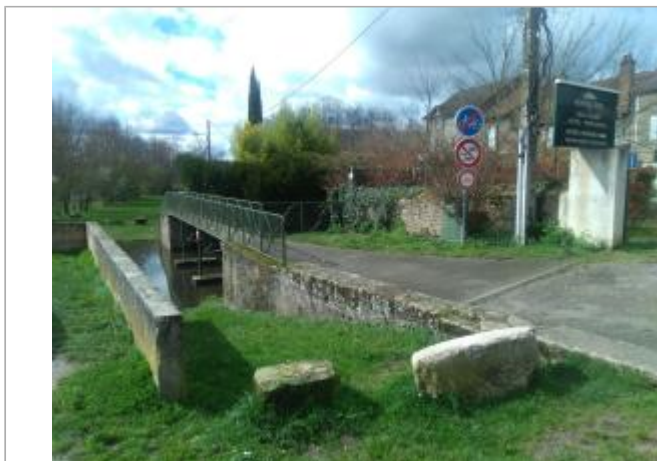
Vue du site en 2024

Coordonnées WGS84 : X: 4.29397500 / Y: 46.96111600