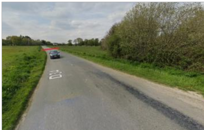
Chaussée de la RD34 à Mordelles