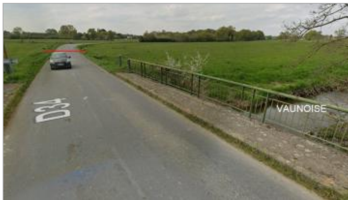
Chaussée de la RD34 à Mordelles

Coordonnées WGS84 : X: -1.86016508 / Y: 48.08202530