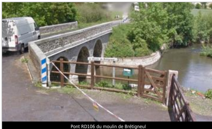
Pont RD106 du moulin de Brétigneul