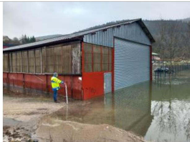
Bâtiment en tôle en rive droite à proximité du pont sur la RD