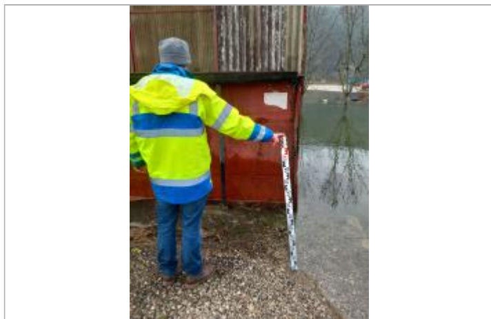
à 1,35m de l'angle du bâtiment, dans le prolongement nord du pignon

Maximum de l'inondation : Non renseigné Visibilité : Oui État du repère : Disparu Pérennité : Aucune