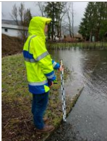
chemin du bar brasserie, sous l'arbre, bordure suivante à celle un peu surélevée (mesure au sol)