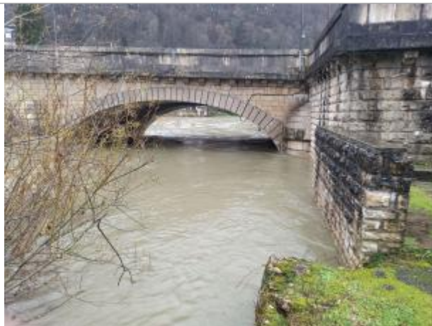
mur amont du pont de la RD437 (rive droite)

Coordonnées WGS84 : X: 6.81318698 / Y: 47.31875230