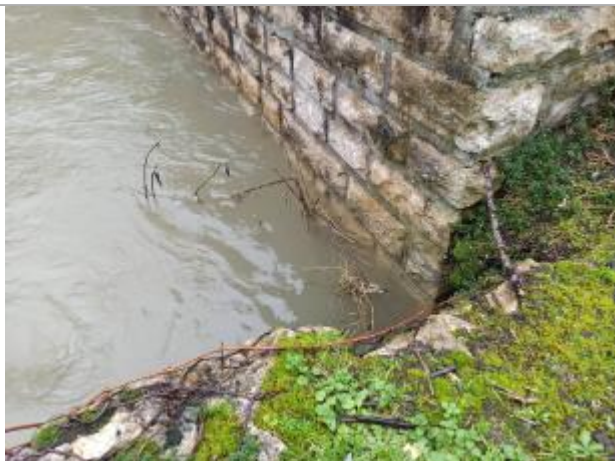
En amont du pont RD 437, 3 rangées de pierres sous le niveau du gabion (branche en référence au niveau du gabion).

EN AMONT DU PONT RD 437, 3 RANGÉES DE PIERRES SOUS LE NIVEAU DU GABION (BRANCHE EN RÉFÉRENCE AU NIVEAU DU GABION). - 16/04/2024