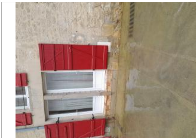
Maison Rue Pasteur

Coordonnées WGS84 : X: 5.14087893 / Y: 48.45900310