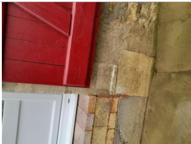
Crue de 1988 : correspond à marque en peinture blanche