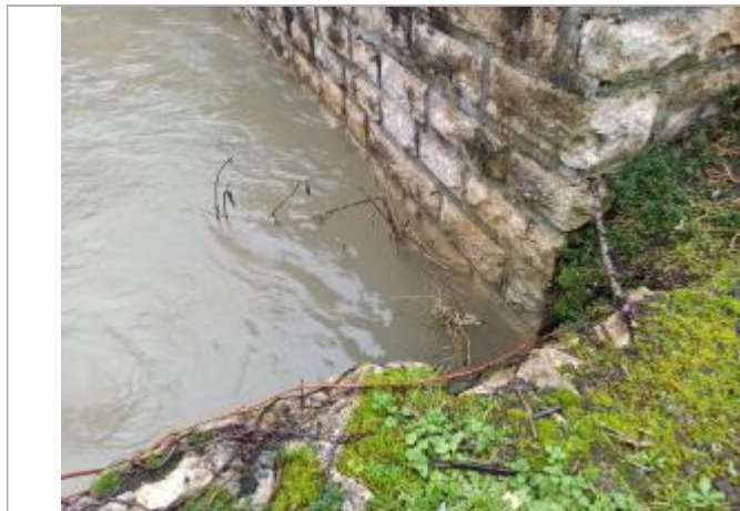
En amont du pont RD 437, 3 rangées de pierres sous le niveau du gabion (branche en référence au niveau du gabion).

EN AMONT DU PONT RD 437, 3 RANGÉES DE PIERRES SOUS LE NIVEAU DU GABION (BRANCHE EN RÉFÉRENCE AU NIVEAU DU GABION). - 16/04/2024