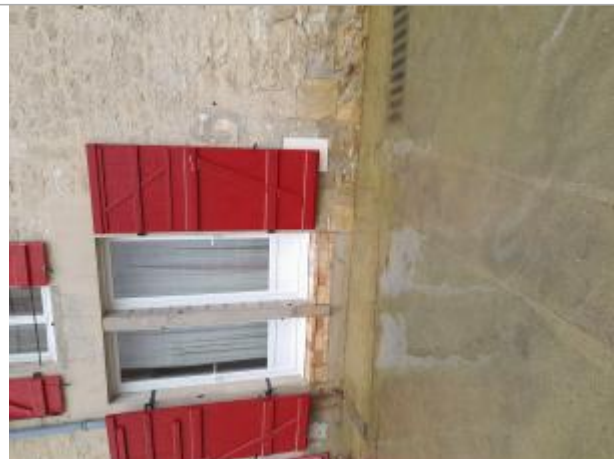
Maison Rue Pasteur