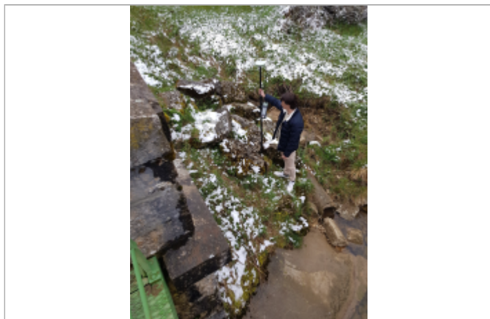
Amont du pont en rive droite, rocher plat entre 2 autres rochers