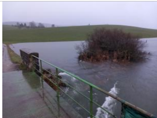
En amont du pont de Sarrageois

Coordonnées RGF93 (ETRS89) : X: 6.2159446 / Y: 46.7235406