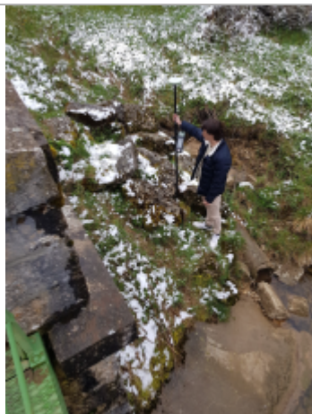
Amont du pont en rive droite, rocher plat entre 2 autres rochers