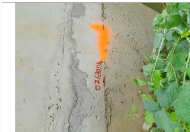
Marque de peinture sur la pile aval rive droite