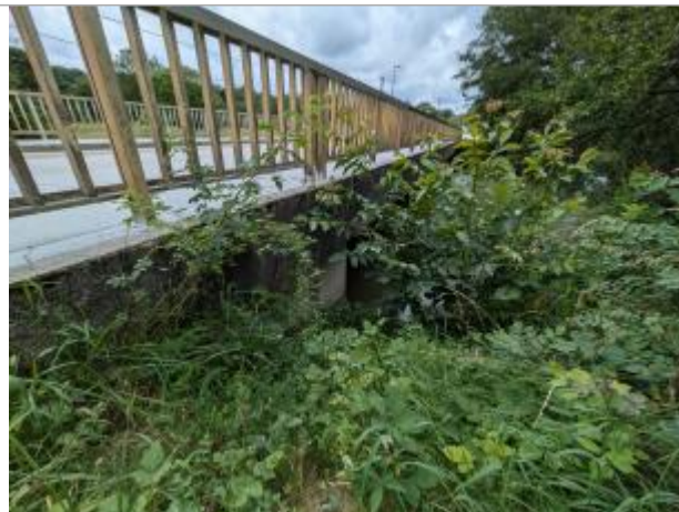
Pile aval rive droite du pont