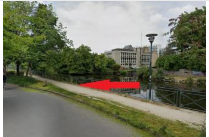
promenade Pierre Gardin de la Gerberie fac à l'écluse Dupont des Loges

Coordonnées WGS84 : X: -1.66763434 / Y: 48.10742100