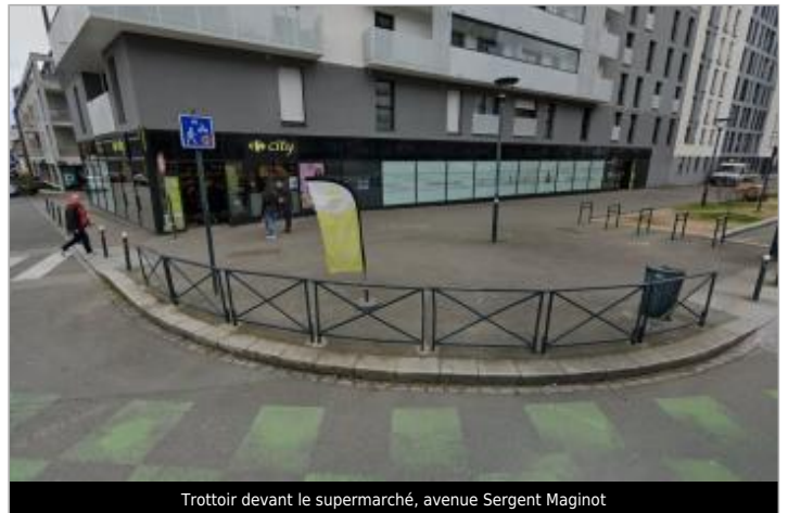
Trottoir devant le supermarché, avenue Sergent Maginot

Coordonnées WGS84 : X: -1.65669980 / Y: 48.10986070