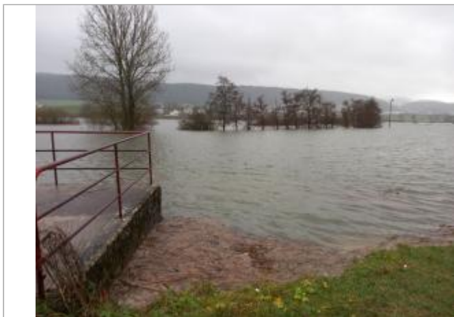
Rue du Stade (face au skate park)