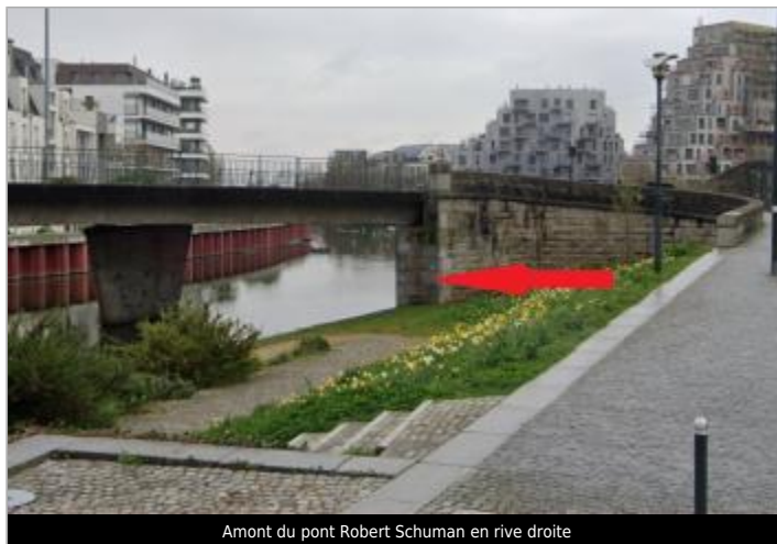
Amont du pont Robert Schuman en rive droite