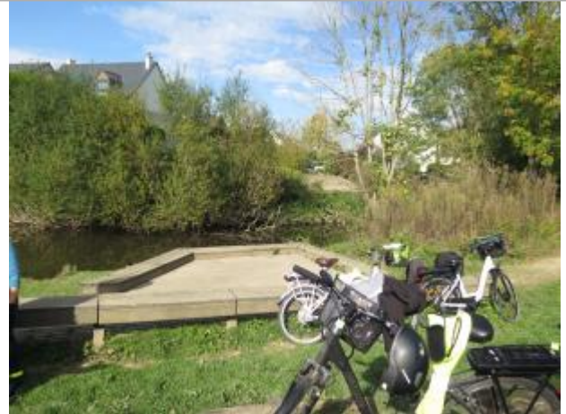
chemin dans les prairies Saint-Martin face à la rue de Camors