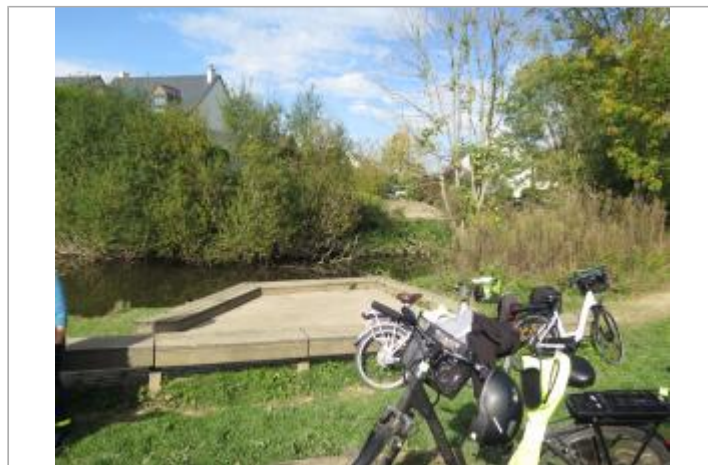
chemin dans les prairies Saint-Martin face à la rue de Camors