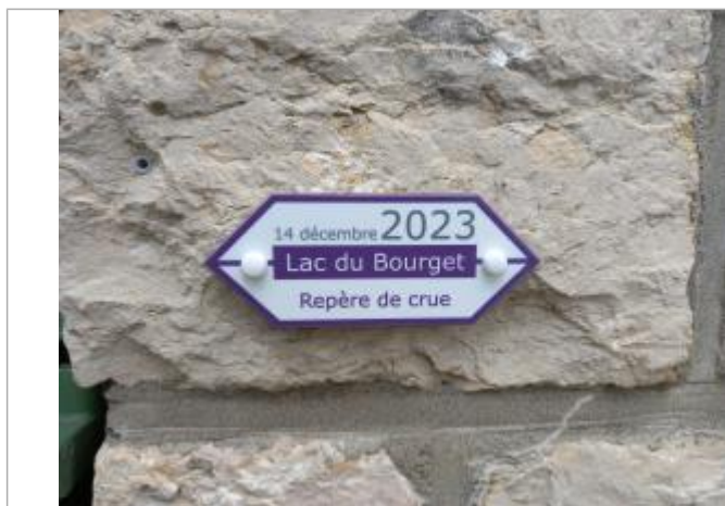
Repère de crue 14 décembre 2023

Altitude calculée de l'eau (en m) : 233.74 m