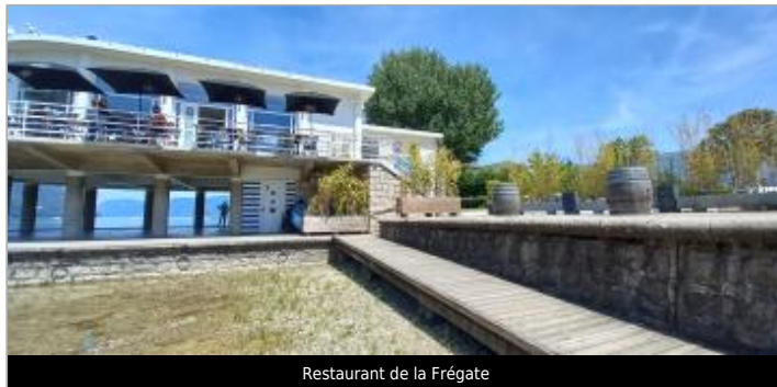
Restaurant de la Frégate

Coordonnées WGS84 : X: 5.86217105 / Y: 45.65599940