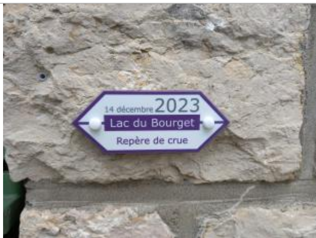
Repère de crue 14 décembre 2023

Altitude calculée de l'eau (en m) : 233.74 m