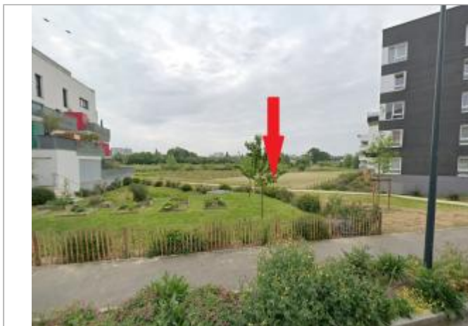
Prairies près de la rue Jack Keroual

Coordonnées WGS84 : X: -1.67622315 / Y: 48.12799810