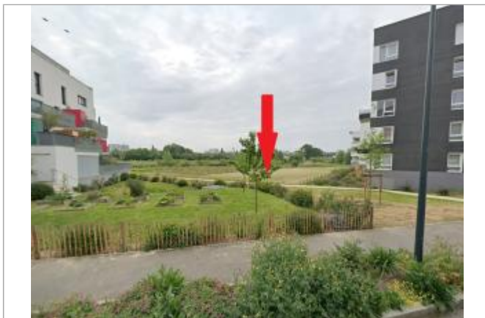
Prairies près de la rue Jack Keroual