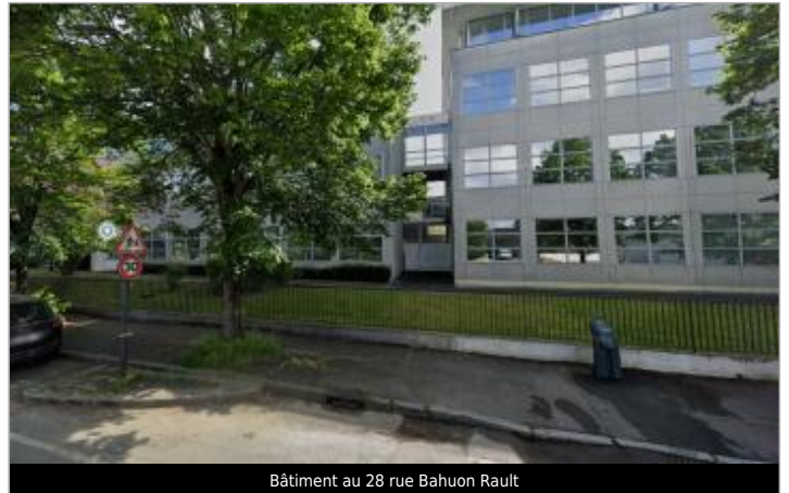
Bâtiment au 28 rue Bahuon Rault