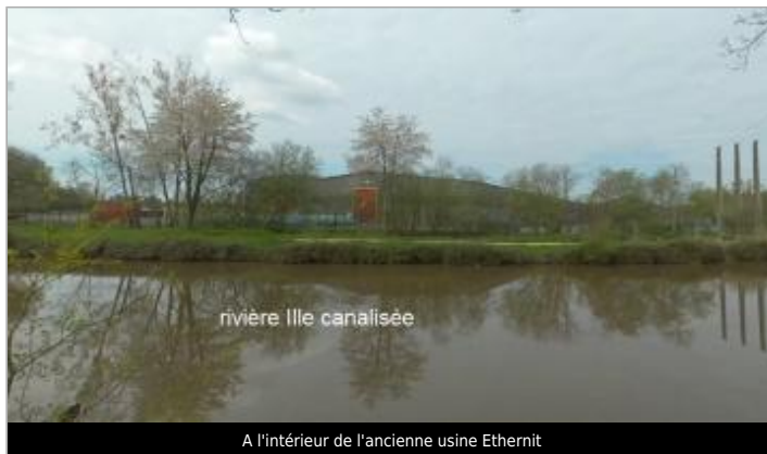
A l'intérieur de l'ancienne usine Ethernit