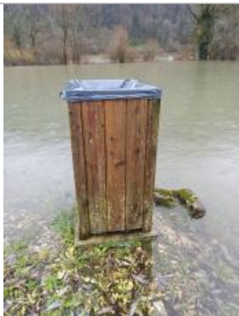
Aval commune, 1 cm sous la dalle de la poubelle