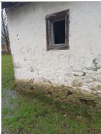
au pied du mur du cabanon, rive gauche en amont du pont: au sol (limite de débordement)