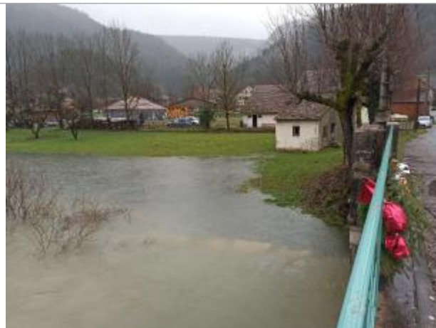
Montancy: amont Pont, rive gauche, sur le TN au pied du mur cabanon

Coordonnées WGS84 : X: 7.04811585 / Y: 47.34793090