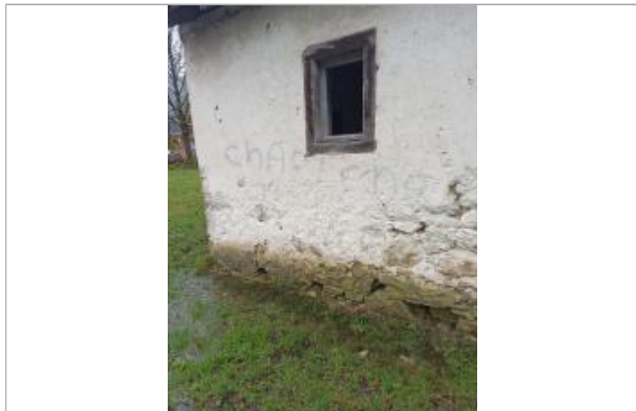
au pied du mur du cabanon, rive gauche en amont du pont: au sol (limite de débordement)