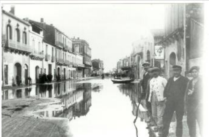
Boulevard de la République

Type de repérage : Campagne de terrain post-inondation