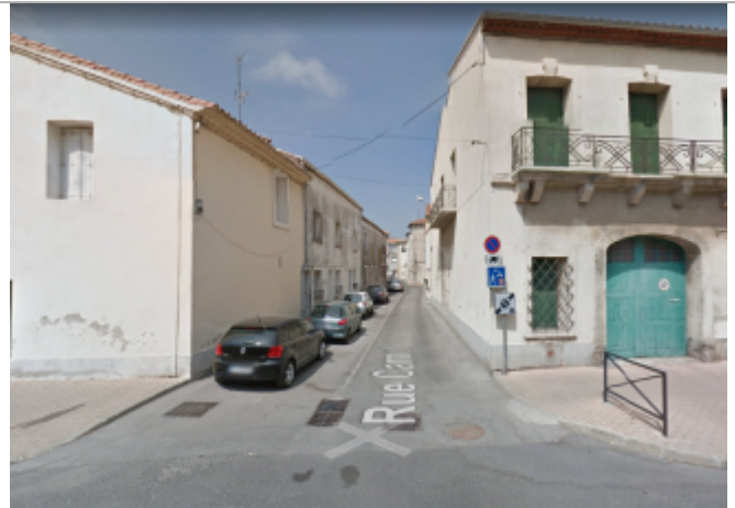
Entrée de la rue Carnot

Coordonnées WGS84 : X: 3.75836270 / Y: 43.44614600