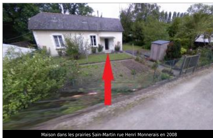
Maison dans les prairies Sain-Martin rue Henri Monnerais en 2008

GÉOLOCALISATION Coordonnées WGS84 : X: -1.67472871 / Y: 48.12201230 Coordonnées RGF93 (Lambert 93) X: 352366.51 / Y: 6790475.78 Coordonnées RGF93 (ETRS89) X: -1.6747287 / Y: 48.1220123 Code Hydro: J71-0300 Rive de référence: Droite