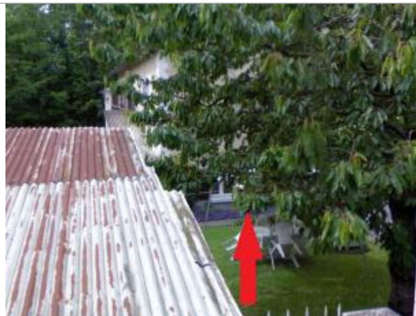
Maison dans les prairies Sain-Martin rue Henri Monnerais