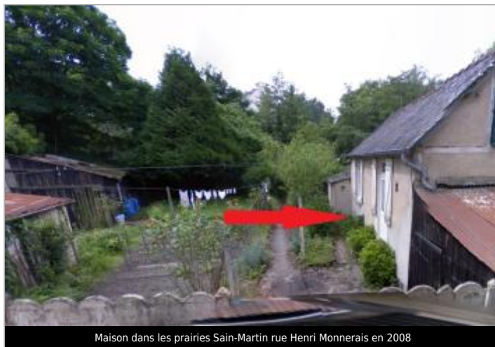
Maison dans les prairies Sain-Martin rue Henri Monnerais en 2008