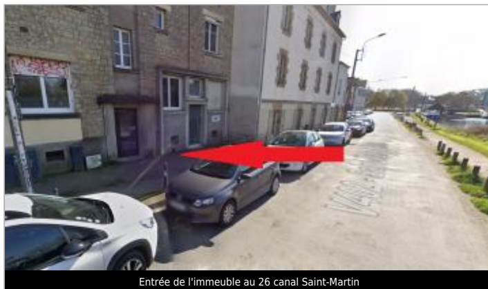
Entrée de l'immeuble au 26 canal Saint-Martin