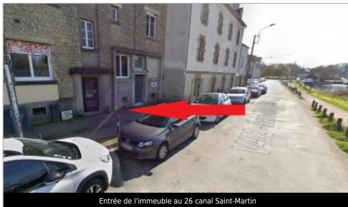
Entrée de l'immeuble au 26 canal Saint-Martin