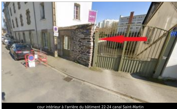
cour intérieur à l'arrière du bâtiment 22-24 canal Saint-Martin