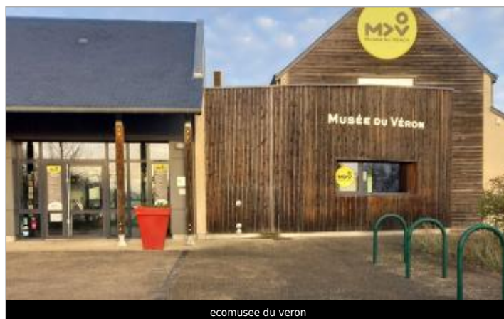
ecomusee du veron

GÉOLOCALISATION Coordonnées WGS84 : X: 0.12451649 / Y: 47.20943800 Coordonnées RGF93 (Lambert 93) X: 482397.33 / Y: 6682756.35 Coordonnées RGF93 (ETRS89) : X: 0.1245165 / Y: 47.209438 Code Hydro: L---0060 Rive de référence: Droite